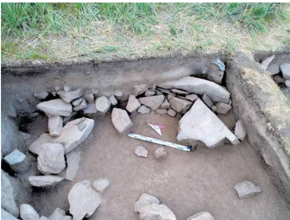
Рисунок 6. Фрагмент развала стены с кладкой