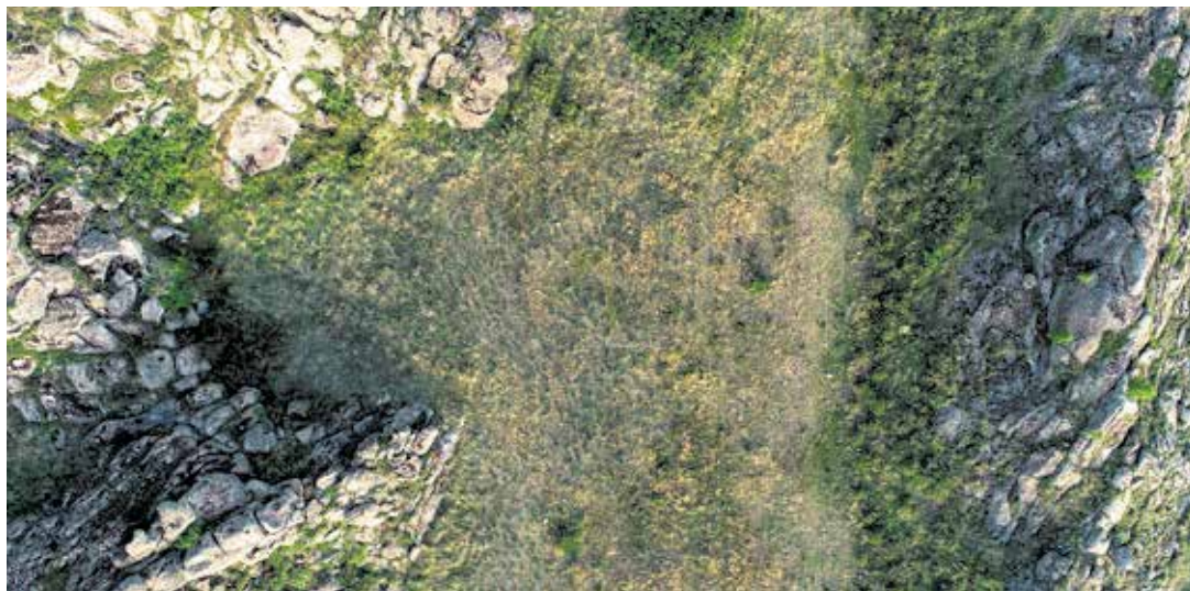
Рисунок 1. Вид на поселение до начала работ

Место для раскопа было выбрано в северо-восточном «кармашке». Первоначально площадка, где расположен раскоп, визуально просматривалась с небольшим подъемом в западной, северной и восточной части, также с этих сторон окружен горной породой, на поверхности фиксировались несколько крупных камней, поставленных вертикально. В плане данные камни образуют полукруг, северо-западная часть его примыкает к горной породе (рис. 1).