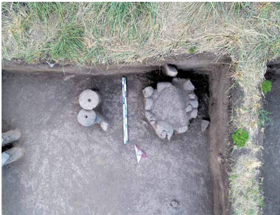
Рисунок 4. Зернотерки (ручная мельница) и очаг в секторе 3

В квадрате J11 сектора 15 был зафиксирован очаг округлой формы. Очаг расположен на сером культурном слое, на глубине 30 см. Диаметр очага – 108 см. Очаг сооружен из средних камней гранита и сланца. На глиняном основании вставлены камни. В заполнении очага, на зольно-сером культурном слое, были зафиксированы фрагменты угля и обожжённые кости.