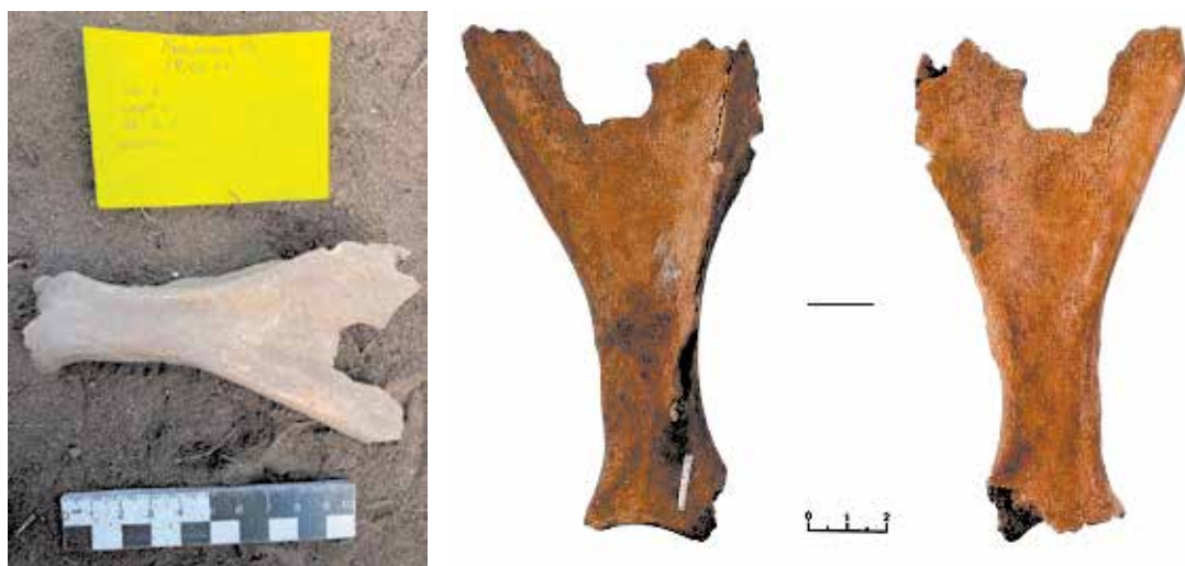
Рисунок 3. Баранья лопатка для гадания

В квадрате К1, в сером культурном слое, на глубине 40 см, выявлена лопатка МРС (рис.3). Она находится между очагом и зернотеркой. Остатки лопатки и акромион были убраны. Предостная ямка сломана, каудальный угол лопатки обрезан в виде V – образной формы. Лопатки надсуставный бугорок сломан, вероятно, был специально убран в те времена. Начиная со средних веков до сегодняшнего времени, гадание на лопатке широко распространено среди баксы (шаманы). В основном, обычай гадания с лопатками проходил возле очага. Как раз у нас предмет был зафиксирован возле очага. По этнографическим материалам можно сделать предварительное заключение, что серый культурный слой относится к 18-19 векам.