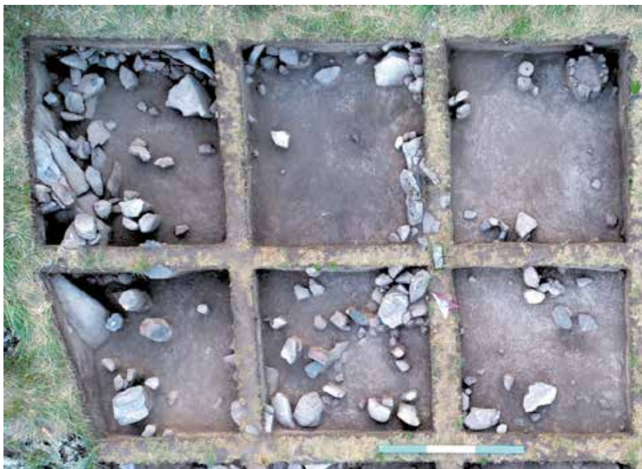
Рисунок 5. Основание постройки 1